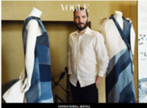
TISSOT / TIZIANO GUARDINI

지속가능성에 대한 관심이 높아지고 있다. 그 중심에 서 있는 디자이너는 바로 티지아노 과르디니(Tiziano Guardini)이다. 그는 2017년 6월 8일 Vogue Italia에서 'Sustainable'라는 주제로 자신의 디자인 철학을 소개했다. 그는 자연에서 영감을 얻어, 지속 가능한 소재를 사용하여 ISKO를 위한 새로운 컬렉션을 디자인했다. 그는 이 컬렉션이 자연에서 영감을 얻어 디자인된 것이라고 말했다.